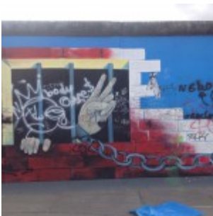
Muro di Berlino – East Side Gallery