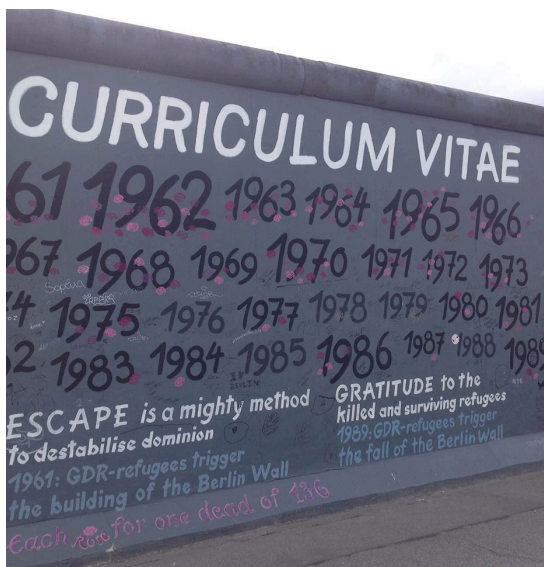
Il muro di Berlino, East Side Gallery