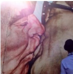
East Side Gallery