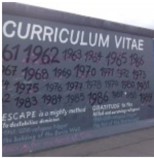
Il muro di Berlino, East Side Gallery