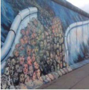
Muro di Berlino – East Side Gallery