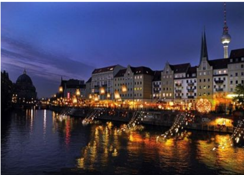
Il quartiere di Nikolaiviertel

Nonostante sia nata in una città sassone, dove il tedesco era la seconda lingua (e l’ho studiato per ben 8 anni!), nonostante durante il regime comunista la Germania (federale) rappresentasse il sogno di libertà che molti videro realizzarsi fuggendo dalla Romania, nonostante due delle mie migliori amiche dei tempi del liceo vivano felicemente lì da oltre vent’anni invitandomi ripetutamente... non ci sono mai stata... fino ad ora. Direi che un tale momento “storico” della mia vita meriti un post su questo blog.