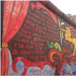
Muro di Berlino – East Side Gallery