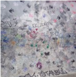
Muro di Berlino – East Side Gallery