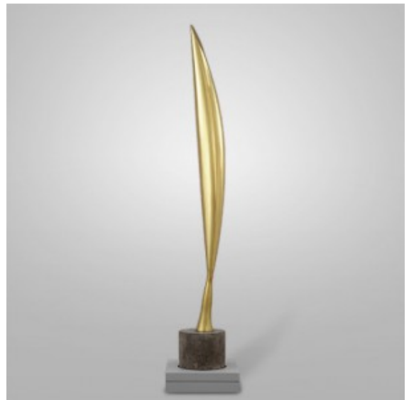
Bird in space

Tutto, nella vita di Brâncuși, come nelle sue opere, è affascinante. Forse per quella particolare atmosfera eterea, semplice, essenziale, che attraversa la sua vita e la sua arte. Molti lo considerano tra gli ideatori dell'arte moderna, il primo a riuscire dove sembrava impossibile: scolpire nel marmo l'idea, il concetto, il movimento, il volo. L'artista stesso sostiene che nelle sue opere “non crea uccelli, ma i voli” .