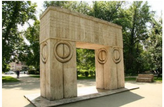
Porta del Bacio

di fare parte di nessuna corrente, di nessun circolo, di nessun gruppo. Nel suo atelier lavorano come assistenti Amedeo Modigliani e Isamu Noguchi .