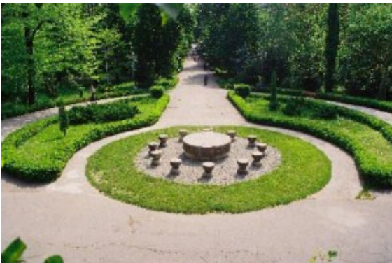
Tavolo del Silenzio

Il complesso di Targu Jiu si sviluppa lungo un viale che parte dalla riva del fiume Jiu, dove si trova il Tavolo del Silenzio , formato da un tavolo e di 12 sedie, definito dallo stesso artista come un'espressione dell' Ultima Cena , fino a raggiungere l'estremo opposto del parco dove, in prossimità dell'entrata principale, si trova la Porta del Bacio , "...una cosa che ci rammenti non una sola coppia, ma tutte le coppie di persone che si sono amate e sono esistite sulla terra..."