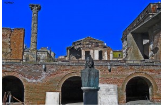
Corte Antica, Statua di Vlad Țepeș

Comincerei a parlare di questa città dal nome che, probabilmente, deriva dalla parola rumena " bucurie ", che significa felicità, gioia . La giusta traduzione sarebbe quindi la " città della gioia ". Ma il documento che attesta la sua nascita racconta tutt'altro. Secondo le fonti storiche antiche, la città è stata fondata nel 1459, sulla riva del fiume Dâmbovița, da Vlad Țepeș , il leggendario Dracula, proprio lui! Vlad III fece costruire la fortezza di Bucarest, prima di una lunga serie di fortificazioni, allo scopo di difendere la Valacchia dagli attacchi dei turchi. Verso la fine del sedicesimo secolo, Bucarest era la più grande città cristiana del sud-est europeo.