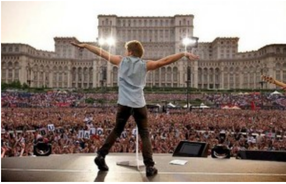
Bon Jovi a Bucarest di fronte alla Casa del Popolo

Bucarest non è una città monumentale, né appariscente a prima vista, va scoperta a poco a poco, perché nasconde le sue bellezze e anche i suoi misteri, tra le vie e nei quartieri. Per decenni, è stata vittima della politica architettonica folle del dittatore Ceaușescu, che sognava di costruire un'intera città nuova, sul modello coreano o cinese, distruggendo quella antica. La Casa del Popolo , attualmente sede del Parlamento rumeno, richiese il sacrificio di centinaia di edifici storici, chiese e abitazioni ( Casa del Popolo? Leggi qui. ). Com'è facile immaginare, proprio questo monumento che testimonia un periodo tra i più bui della storia del paese, rappresenta oggi la più grande attrazione turistica della capitale. La Casa del Popolo è nel Guinness World Record con tre primati: il più grande, il più costoso e il più pesante edificio amministrativo del mondo! Davanti al grandioso edificio si apre la Piazza della Costituzione, luogo in cui si sono svolti, dopo la caduta del comunismo, quasi tutti i grandi eventi musicali internazionali.