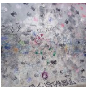
Muro di Berlino – East Side Gallery