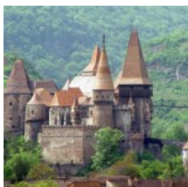
Castello degli Hunyad

C'è un castello tenebroso nei Carpazi che avrebbe potuto ispirare Jules Verne: si trova a Hunedoara , alle pendici dei Carpați Meridionali, ed è considerato uno dei più misteriosi castelli dell'Europa dell'Est. Si tratta del Castello degli Hunyadi , detto anche il Castello dei Corvin , che la guida Lonely Planet descrive così: "In nessun luogo della Romania il contrasto tra passato e presente è così stridente come a Hunedoara, dove i giganteschi scheletri di acciaierie abbandonate fanno da cornice spettrale ed arrugginita a uno dei castelli più belli dell'Europa Orientale: Castello degli Hunyadi o Castello Corvino, una fortezza gotica del XIV secolo che si è conservata intatta ed è considerata una della gemme architettoniche della Transilvania" .