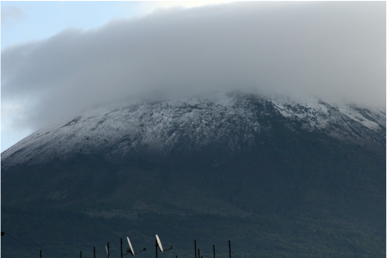
Vezuviul în nori

Traseul virtual are 70 de instalații multimediale, coordonate cu ajutorul unui software original. Pentru amenajarea sălilor, au fost necesari trei ani și s-au cheltuit peste 10 milioane de euro. Vizitatorul evadează în trecut doar cu ajutorul simțurilor: olfactiv, tactil, auditiv și, bineînțeles, cel al văzului. Aici bijuteriile din aur sunt holograme și se aude ploaia care cade pe acoperișul caselor. În termele romane, se simte parfumul uleiurilor cu care se desfătau romanii și se pot șterge cu dosul palmei oglinzile aburite.