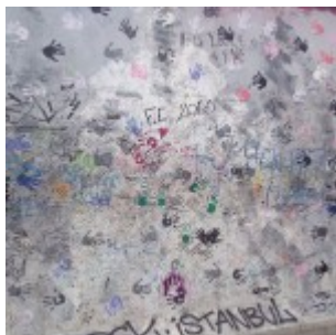
Muro di Berlino – East Side Gallery