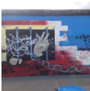
Muro di Berlino – East Side Gallery